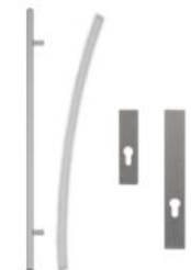
Antaba gięta 150 cm