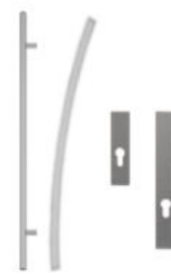
Antaba gięta 150 cm