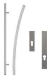
Antaba gięta 100 cm