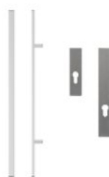
Antaba 150 cm