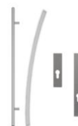
Antaba gięta 150 cm