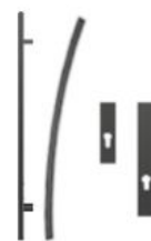
Antaba gięta 150 cm