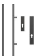
Antaba 150 cm