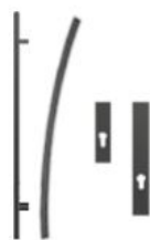
Antaba gięta 100 cm