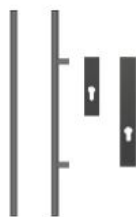
Antaba 100 cm