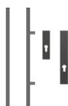
Antaba 150 cm